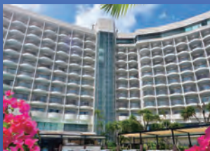
ロワジールホテル那覇