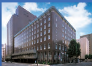
札幌グランドホテル