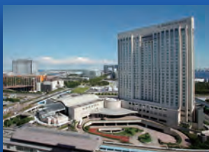
グランドニッコー東京台場